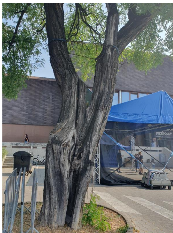
detail poškodeného kmeňa