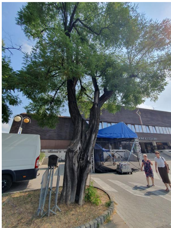
strom č. 1 – celkový pohľad