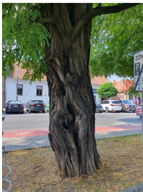
detail poškodenia kmeňa