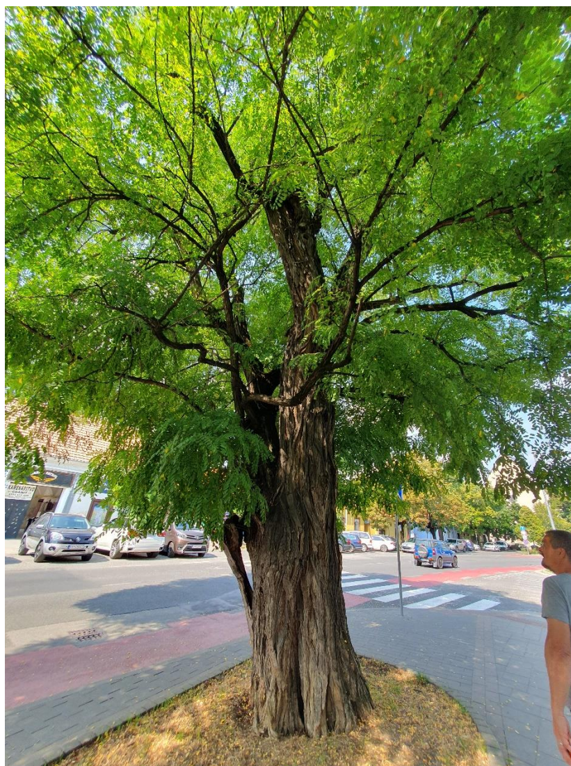
strom č. 3 – celkový pohľad

PRK – lokálna/parciálna redukcia koruny pre zabezpečenie dostatočnej podchodnej a podjazdnej výšky, RK 30 – 40% - redukcia koruny, I – inštalácia statickej – podkladnicovej väzby pod rozdvojením kmeňa, PV – prístrojové vyšetrenie ťahovými skúškami Priorita 1